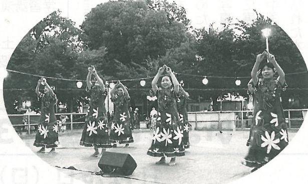
フラダンス「ブルメリア」のみなさん