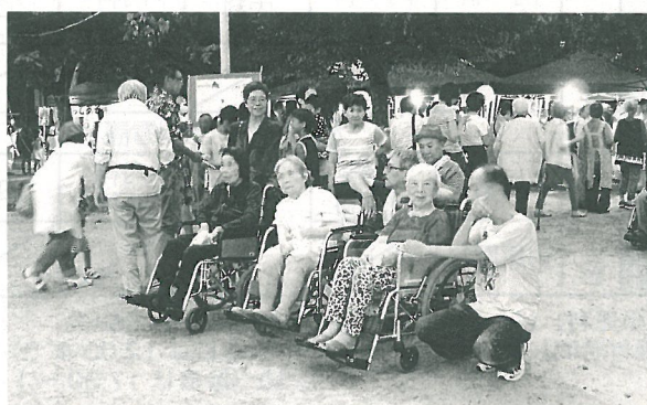
老若男女 多くの人でにぎわいました