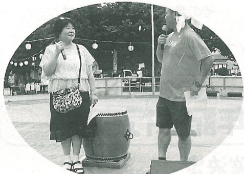
軽妙な語りの司会者

8月26日(土)南中本公園で「第18回東成納涼平和まつり」が開催されました。開会の挨拶のあと、学童保育所の子供たちの太鼓や歌、いまざとフォークジャンボリーの歌と音楽でオープニング。今年は公園の真ん中にある藤棚が取り払われて格好の舞台となり、民謡、フラダンス、よさこい踊りなど多彩な出し物が披露されました。たくさんのお客様が並び早々と完売の店もありました。人気の福引きは長蛇の列。ピンクの半被や浴衣の人たちで踊りの輪が広がり老いも若きも賑やかにまつりを楽しみました。