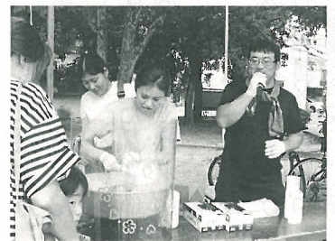
森の宮歯科のおいしい綿菓子