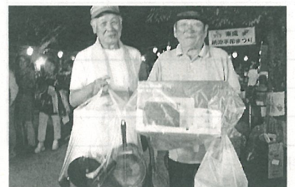
特賞当選おめでとう