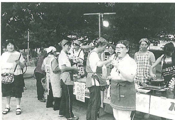
いまざとヘルパーステーションの焼きそば