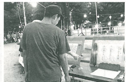
平和憲法スタンプラリーも好評でした