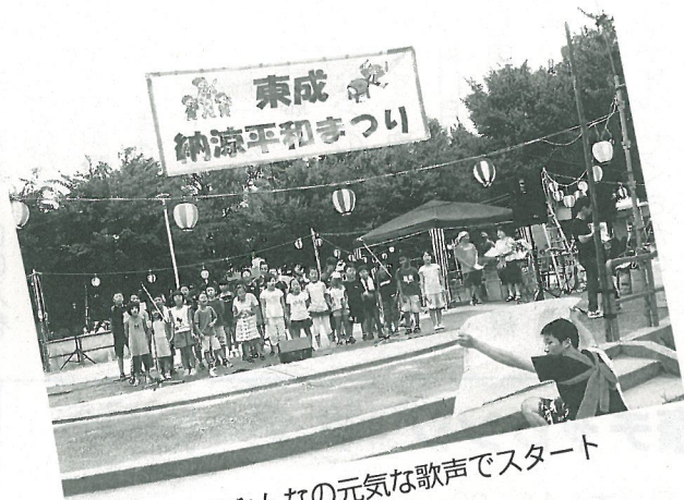
学童のみんなの元気な歌声でスタート