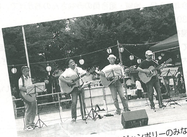
今年も出演 いまざとフォークジャンボリーのみなさん