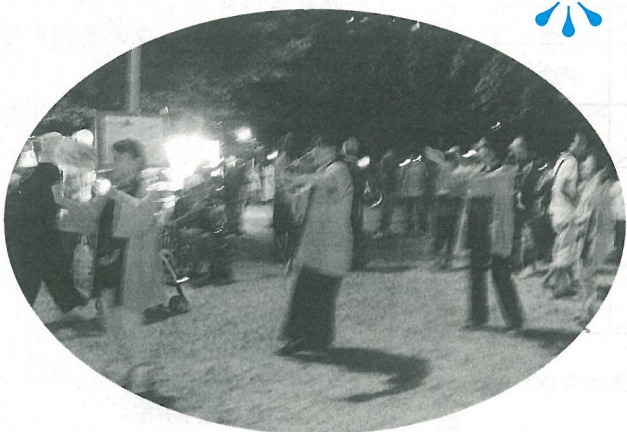
盆踊りで大きな輪ができました