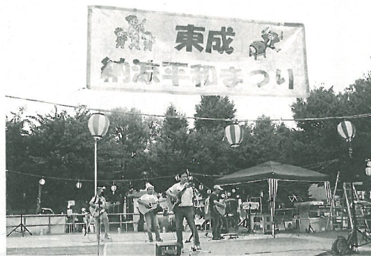
平和まつりは18回目です

8月26日(土)南中本公園で「第18回東成納涼平和まつり」が開催されました。開会の挨拶のあと、学童保育所の子供たちの太鼓や歌、いまざとフォークジャンボリーの歌と音楽でオープニング。今年は公園の真ん中にある藤棚が取り払われて格好の舞台となり、民謡、フラダンス、よさこい踊りなど多彩な出し物が披露されました。たくさんのお客様が並び早々と完売の店もありました。人気の福引きは長蛇の列。ピンクの半被や浴衣の人たちで踊りの輪が広がり老いも若きも賑やかにまつりを楽しみました。